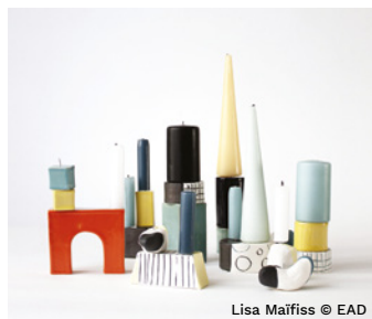
Lisa Maiffiss © EAD

Plusieurs designers, designer d'espace, produit, UX... seront conviés à un workshop pour échanger sur les nouvelles façons de manger en lien avec les tendances de consommation et les nouveaux comportements sociétaux. À l'issue de ce workshop, une restitution du travail des designers sera présentée à plusieurs professionnels du monde de la restauration et de